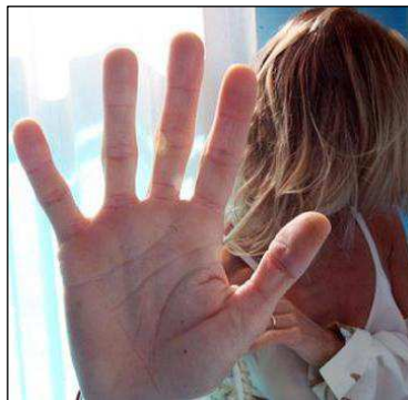
immagine tratta dalla rete

Non bisogna tentare di curare il corpo senza la psiche. Platone